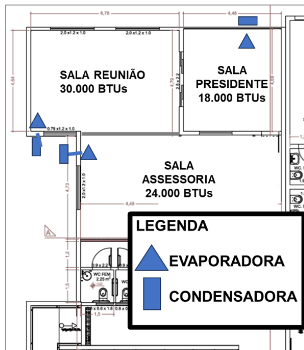
Imagem 2 – Croqui instalação aparelhos de 18.000, 24.000 e 30.000 BTUs

O aparelho de 24.000 BTUs será instalado na sala da assessoria e o de 30.000 BTUs será instalado na sala de reuniões. Ambas saídas de esgoto serão direcionadas livremente, já que a área externa é de jardim interno da Câmara.